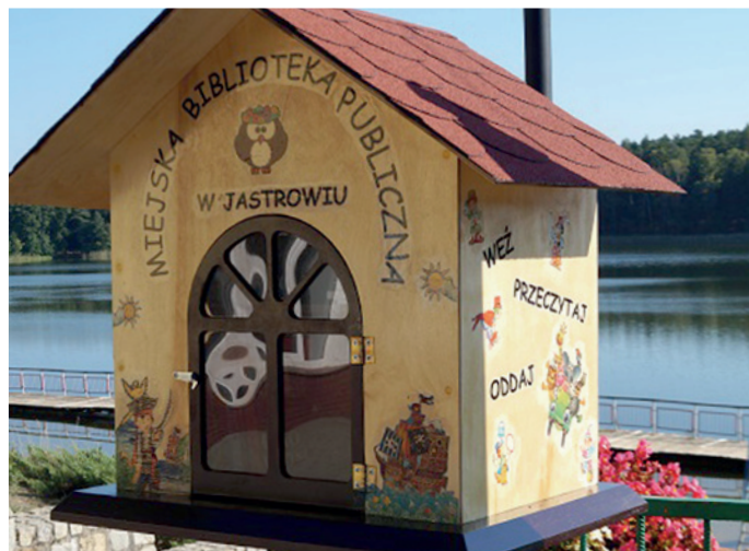
▲ Bookcrossing - budka „Uwolnij książkę” na plaży miejskiej ▼ Noc detektywów