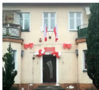
▲ Stowarzyszenie Uśmiech Dziecka w Jastrowiu