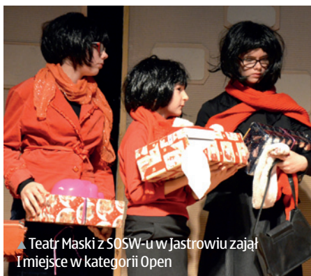
▲ Teatr Maski z SOSW-u w Jastrowiu zajęł I miejsce w kategorii Open