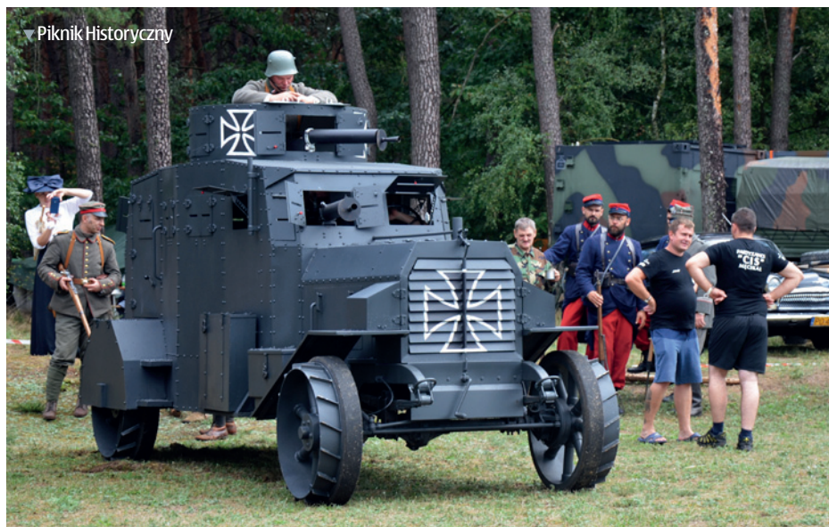
▼ Piknik Historyczny