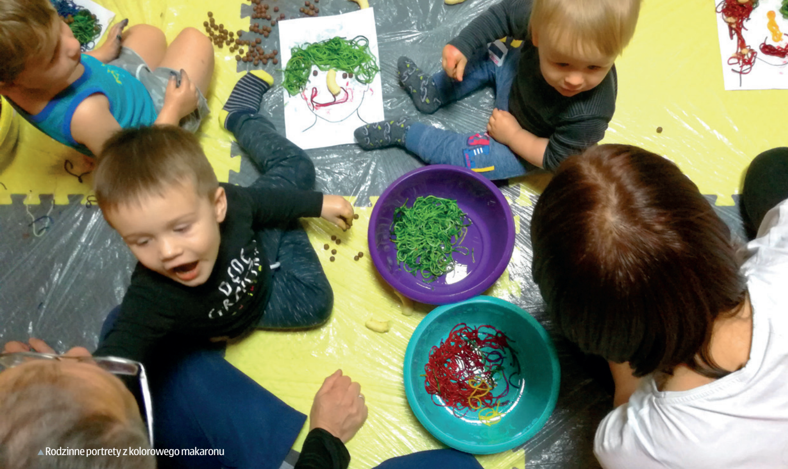
▲ Rodzinne portrety z kolorowego makaronu