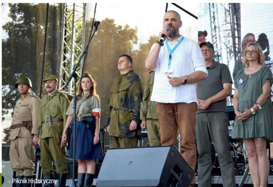
▲ Piknik Historyczny