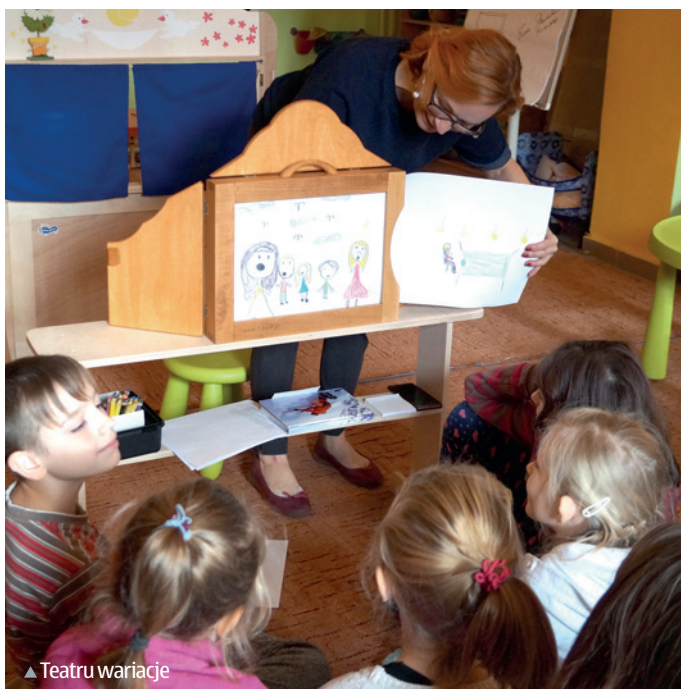
▲ Teatru wariacje