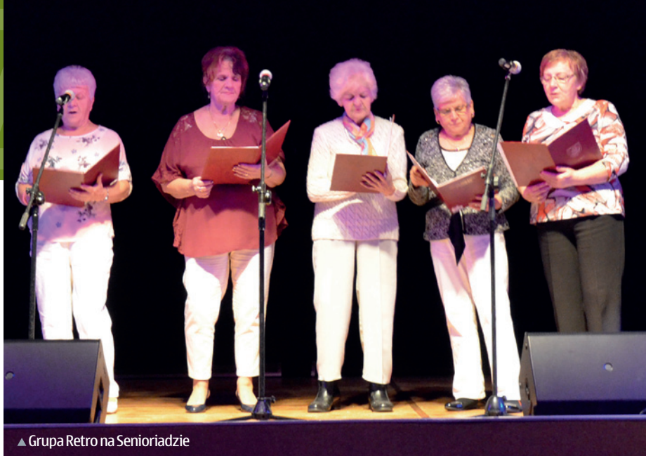
▲ Grupa Retro na Senioriadzie