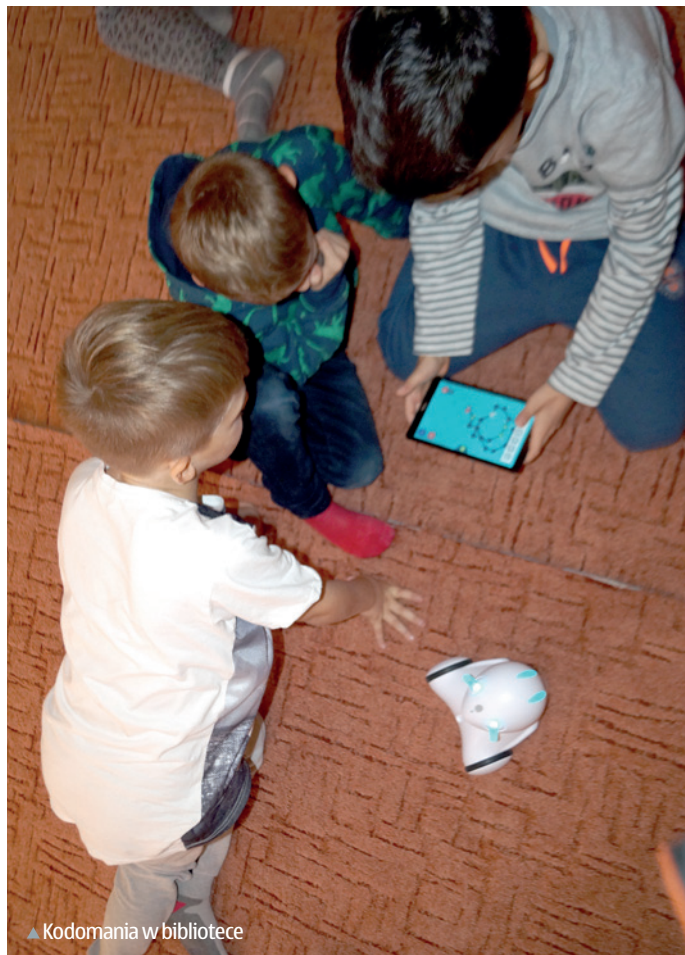
▲ Kodomania w bibliotece