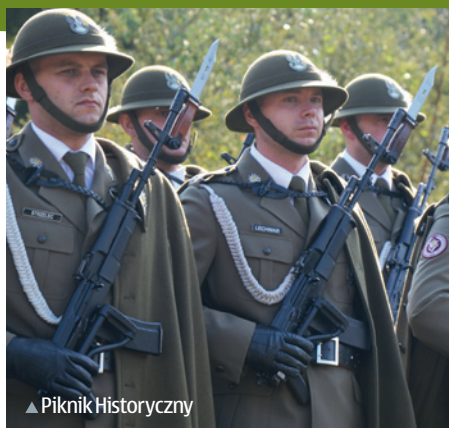
▲ Piknik Historyczny