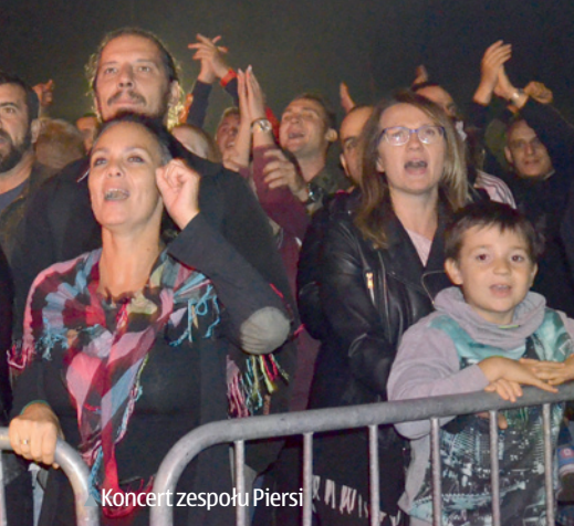
Koncert zespołu Piersi