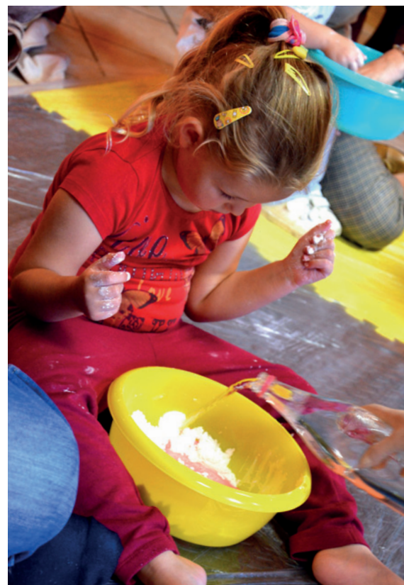
▲ Odrobina mąki, oleju, wody, nutka zapachu i koloru - tak powstaje ciastolina

Przyjdź do nas i daj szansę swojemu dziecku na rozwój jego kreatywności oraz twórczego myślenia!