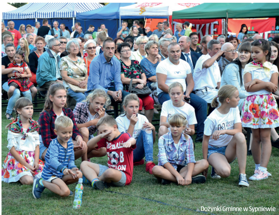
▲ Dożynki Gminne w Sypniewie