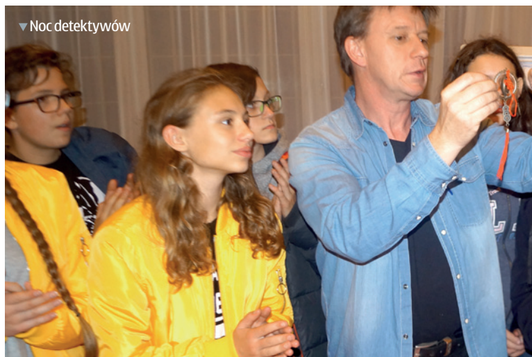
▼ Noc detektywów