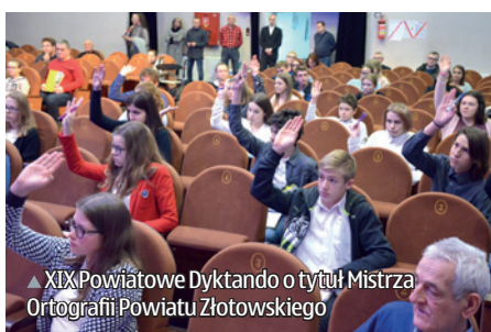
▲ XIX Powiatowe Dyktando o tytuł Mistrza Ortografii Powiatu Złotowskiego