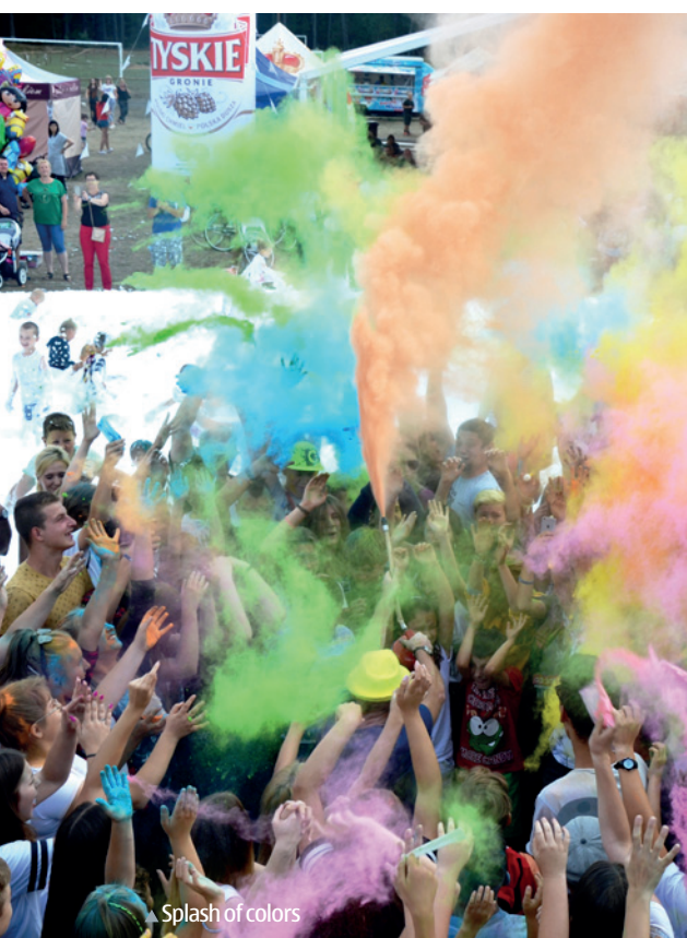
▲ Splash of colors