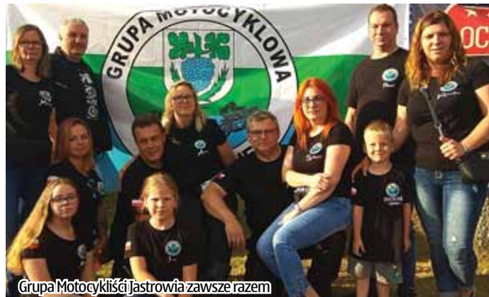
Grupa Motocykliści Jastrowia zawsze razem