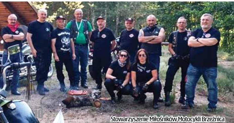
Stowarzyszenie Miłośników Motocykli Brzeźnica