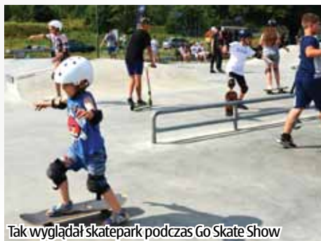
Tak wyglądał skatepark podczas Go Skate Show