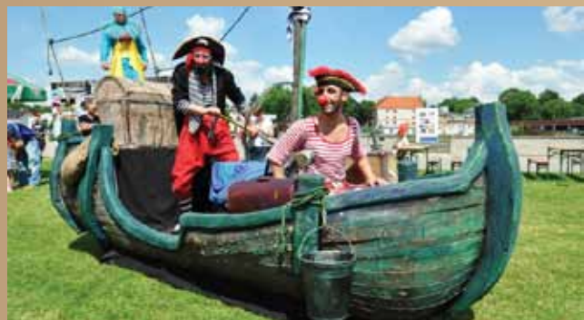
Kapitan Drabinka i jego załoga już 11 sierpnia rozbawią Was do łez