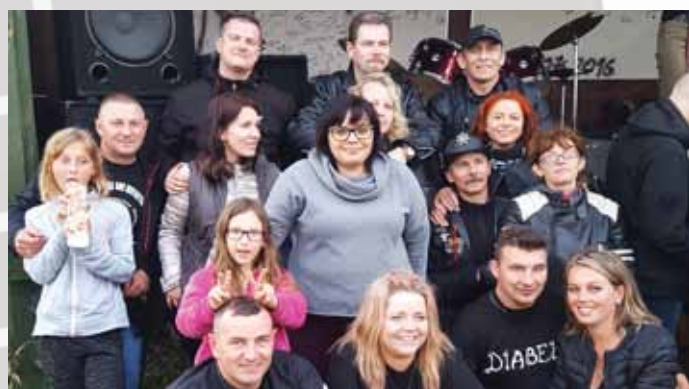
Stowarzyszenie Motocyklistów Freedom