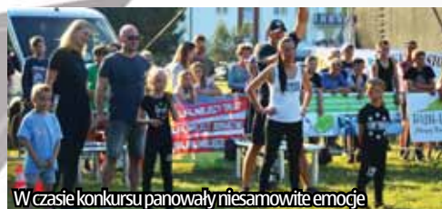
W czasie konkursu panowały niesamowite emocje