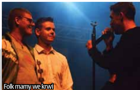
Folk mamy we krwi