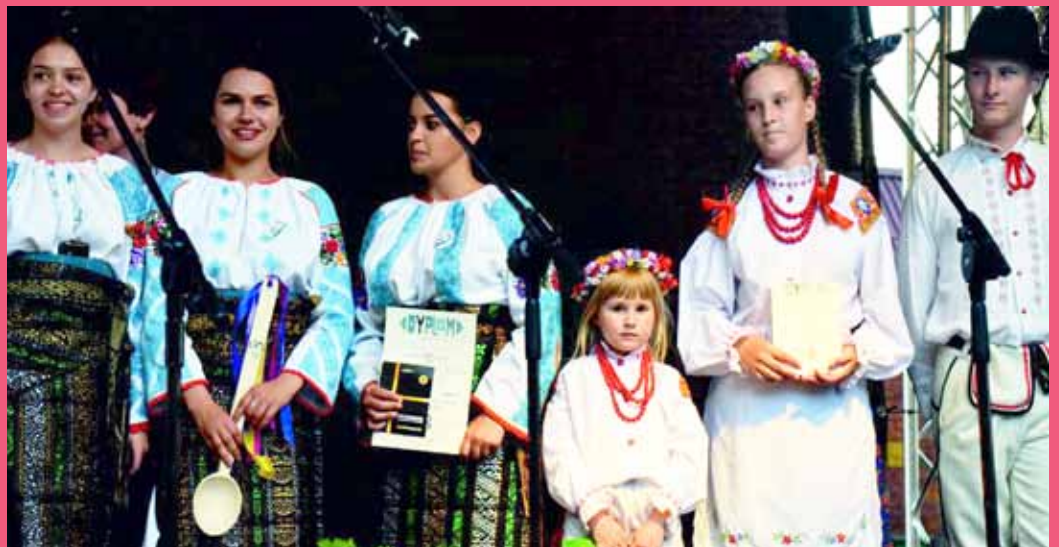
W TYM ROKU O CZADOWĄ KOPYŚĆ WALCZYŁY DZIECI I MŁODZIEŻ