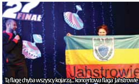
Tą flagę chyba wszyscy kojarzą... koncertowa flaga Jastrowie

Sponsorzy: Samorząd Województwa Wielkopolskiego, powiat złotowski, gmina i miasto Jastrowie, Aktualności Lokalne. Organizatorzy: Ośrodek Kultury w Jastrowiu,