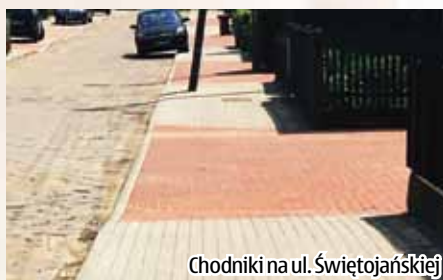
Chodniki na ul. Świętojańskiej

Przebudowa chodników na Świętojańskiej to inwestycja o wartości 249 037,72 zł, która realizowana była przez firmę Roboty Drogowo-Budowlane Jacek Karpiński. W ramach podpisanej umowy przebudowane zostały chodniki po obu stronach ulicy Świętojańskiej wraz ze zjazdami. Nawierzchnia wykonana jest z kostki betonowej. W ramach umowy wykonane zostały prace rozbiórkowe, ustawiono krawężniki, przebudowano nawierzchnię chodnika i zjazdów oraz przełożono na niektórych odcinkach nawierzchnię jezdni. Zadanie realizowano ze środków własnych gminy i miasta Jastrowie.