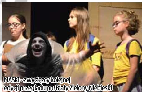
MASKI - zwyciężcy kolejnej edycji przeglądu pn. Biały Zielony Niebieski

w Nadarzycach. Majówka minęła nam śpiewając z Operetką Poznańską i zespołem Trio Band oraz kolejną edycją Przeglądu im. C. Igiel. W czerwcu Jastrowie stało się Bukowiną za sprawą jubileuszowego XXX MFF Bukowińskie Spotkania. Koncert zespołu Future Folk utwierdził wszystkich, że folklor mamy we krwi.