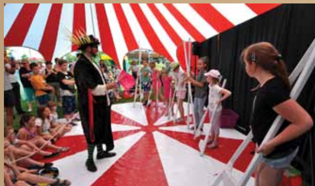
Sztuczki kapitana to nie jedyna atrakcja, która na Was czeka