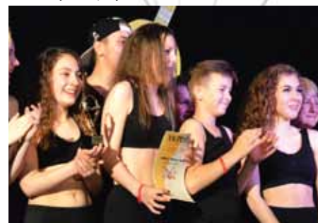
Laureaci tegorocznej edycji przeglądu artystycznego im. Cecylii Igiel

Specjalny Ośrodek Szkolno-Wychowawczy im. Polskich Olimpijczyków w Jastrowiu, Gminna Komisja Profilaktyki i Rozwiązywania Problemów Alkoholowych w Jastrowiu, Stowarzyszenie Inicjatyw Lokalnych Możemy Więcej.