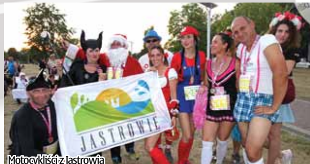
Motocykliści z Jastrowia

Sezon w pełni. Na drogach pojawiło się mnóstwo motocykli. Właściciele tych pięknych maszyn mieszkają również w Jastrowiu.