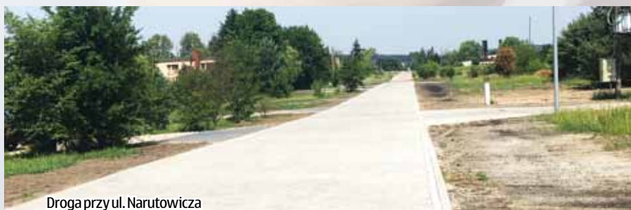
Droga przy ul. Narutowicza