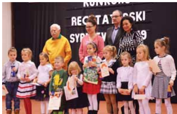
XVII Gminny Konkurs Recytatorski w Sypniewie cieszy się coraz większą popularnością. W tym roku udział wzięło ponad 50 uczestników