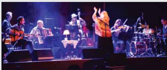
Stanisława Celińska poderwała do tańca całą publiczność. Chwilę później wszyscy mogli przenieść się do miejsc, gdzie czas stoi w miejscu