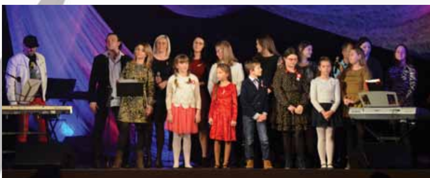
Nasi uzdolnieni lokalni artyści podczas koncertu pn. Kochajmy się z okazji 11 listopada

Tego wieczoru podczas koncertu pn. „Kochajmy się” w sali widowiskowej OKJ spędziliśmy wspólnie czas przy piosenkach o miłości. Tamże 27 listopada obchodziliśmy Dzień Seniora, gdzie grupy taneczne i wokalne OKJ pięknie prezentowały swoje umiejętności.