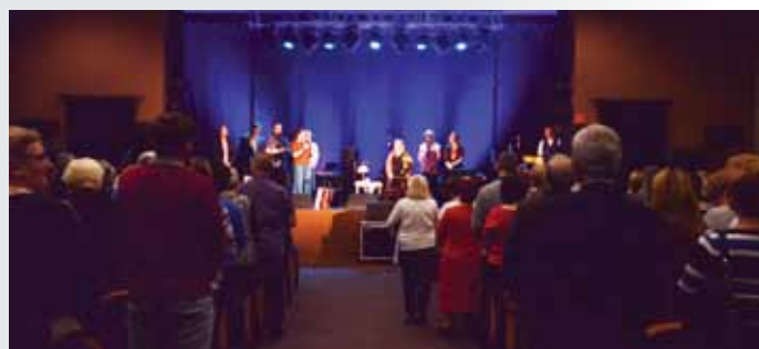
Owacje na stojąco, niemal podczas każdego z utworów, które publiczność mogła usłyszeć w tak wyjątkowy wieczór