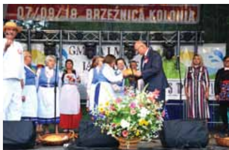
Symboliczne przekazanie chleba wóldarzewi naszej Gminy przez Zespół Folklorystyczny Morowe Teściowe. Tegoroczne Dożynki Gminne w Brzeźnicy Kolonii

Obchody 11 listopada zaczęliśmy już 8 listopada na placu Jana Pawła II, gdzie odbyła się manifestacja Niepodległościowa. 11 listopada spotkaliśmy się w kościele pw. Św. Michała Archanioła ze sztandarem 21. CPL, a punktualnie o godz. 12 zaśpiewaliśmy wspólnie hymn, uczestnicząc w akcji Niepodległa do Hymnu.