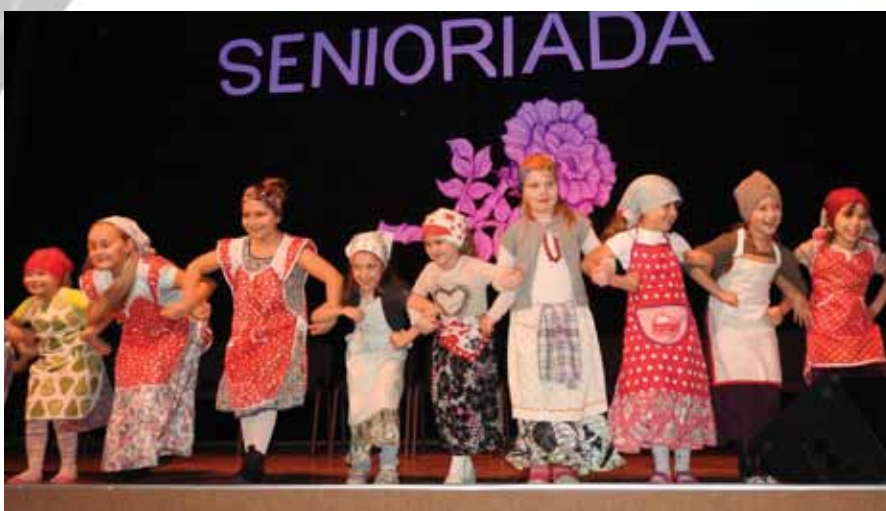
Podczas Senioriady wystąpiły dzieci i młodzież uczęszczająca na warsztaty w OKJ. Występ grupy tanecznej Asioy nagrodzony gromkimi brawami

Nadchodzącą zimą i czas świąteczny uczciemy Jarmarkiem Mikołajkowym.