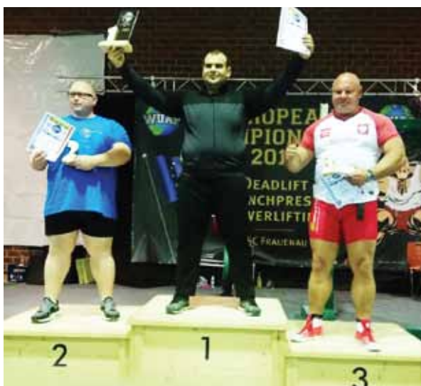
Mistrzostwa Europy: 1. Armenia, 2. Niemcy, 3. Polska - w Trójboju Siłowym