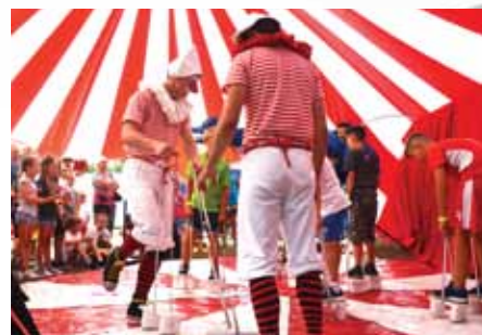
Zabawna, daleka i ciekawa podróż do krainy smoka z Kapitanem Drabinką i fantastycznym Teatrem Kubika