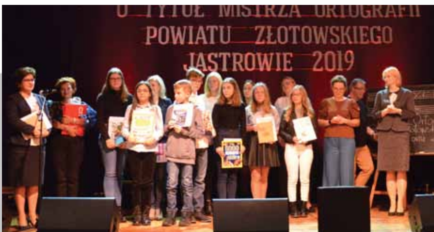
Laureaci XX Dyktanda Powiatowego w Jastrowiu podczas wręczania nagród z rąk specjalnego gościa, wybitnej artystki Pani Stanisławy Celińskiej