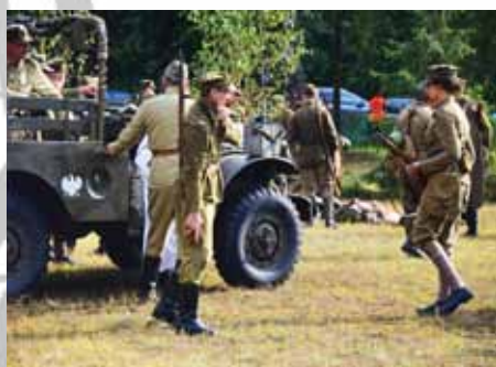
Dreszcze, wzruszenie i nawet łzy... taką lekcję historii przeżyliśmy podczas inscenizacji historycznej bijąc pierwszy rekord Polski na największą lekcję historii