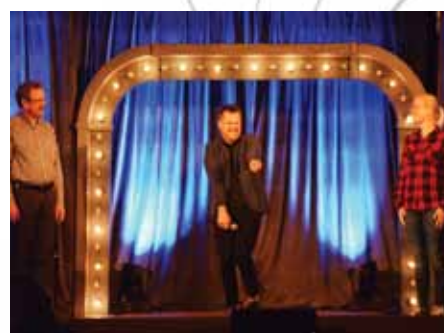
Nie tylko panowie z Kabaretu Paraniennormalni mają dystans do siebie i dobry humor - zaskoczyli ich też nasi mieszkańcy