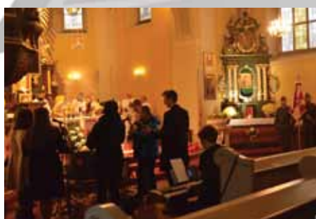
Uroczysta Msza Święta za Ojczyznę w kościele pw. św. Michała Archanioła w Jastrowiu przy asyście honorowej ze sztandarem 21. CPL z Nadarżyc