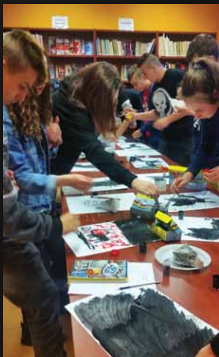
Utwór Wisławy Szymborskiej „Kot w pustym mieszkaniu” stał się tematem działań artystycznych. Powstały prace graficzne w wykonaniu uczniów SP w Sypniewie.