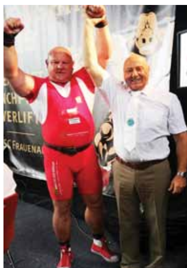
Rekord Europy zatwierdzony przez austriackiego sędziego i mamy to! Miła chwila dla każdego zawodnika, ręka uniesiona przez głównego sędziego