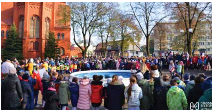
Plac Jana Pawła II podczas Manifestacji Niepodległościowej

Obchody 11 listopada zaczęliśmy już 8 listopada na placu Jana Pawła II, gdzie odbyła się manifestacja Niepodległościowa. 11 listopada spotkaliśmy się w kościele pw. Św. Michała Archanioła ze sztandarem 21. CPL, a punktualnie o godz. 12 zaśpiewaliśmy wspólnie hymn, uczestnicząc w akcji Niepodległa do Hymnu.