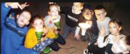
Biblioteka nocą skrywa różne tajemnice

czyńskiego "12 kolorów" wprowadziły w świat barw grupę dzieci z Przedszkola Samorządowego w Sypniewie, które w pochmurny i deszczowy poniedziałek odwiedziły filię biblioteczną. Opowiadanie "Trzy farby Piotrusia" H. Zdzitowieckiej zachęciło do eksperymentów z łączeniem kolorów: czerwień, żółć i niebieski przemieniły się w zieleń, fiolet i pomarańcz. Przedszkolaki pomalowały świat, a na pewno bibliotekę. Było tężowo.