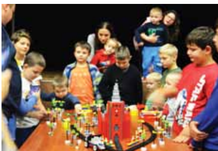
Końcowy efekt współpracy wszystkich uczestników warsztatów z LEGO