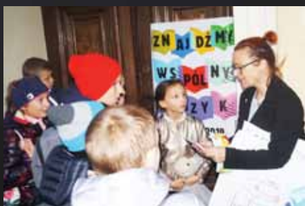
Noc biblioteki i podróż do tajemniczej Francji

W piątkowy wieczór spotkaliśmy się na placu Jana Pawła II i wystartowaliśmy z mapą w rękę w podróż do... Francji. Szukając ukrytych kopert i trafnie odpowiadając na pytania trafiliśmy na ekranizację komiksu "Ptyś i Bill". To perypetie francuskiej rodziny i ich psa Billa. Ze zdobytymi kopertami i kredkami w rękę szukaliśmy wspólnego języka. Przygoda i świat sztuki tego wieczoru były nam bliskie. Książka Herve Tulleta kazała nam robić różne rzeczy, po czym umalowani ruszyliśmy na strych, wyrzucając z siebie pełną paletę emocji. Skończyliśmy we francuskim stylu - bagietką. Tegoroczne hasło Nocy Bibliotek to "Znajdźmy wspólny język" i my tego wieczoru znaleźliśmy nawet kilka w sobie. Do zobaczenia za rok.