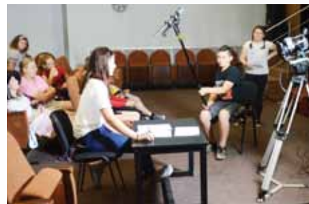
Uczestnicy warsztatów podczas całego cyklu produkcyjnego - od pomysłu, przez scenariusz, reżyserię, realizację zdjęć, montaż, oprawę graficzną i emisję

Za nami pełen wrażeń sezon plenerowy oraz inauguracja nowego roku artystycznego z OKJ. W sierpniu przez 3 dni odbywała się VIII Arena Festiwal 1. Dzień Wolności, podczas której oferowaliśmy Państwu moc atrakcji.