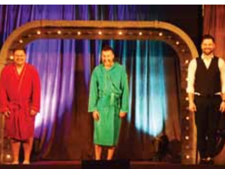
W październiku z humorem OKJ inaugurował nowy rok artystyczny 2019-2020 w towarzystwie kabaretu Paraniennormalni