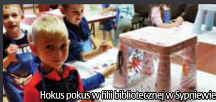
Hokus pokus w filii bibliotecznej w Sypniewie

"Hokus-pokus, czary-mary, ogłaszamy sztuczkę nową przez różowe okulary świat zobaczysz na różowo". Wiersze M.Bryk-