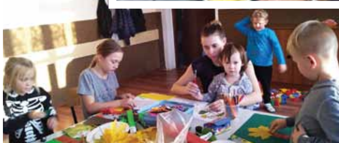
Jesienne warsztaty kreatywne w Świetlicy Wiejskiej uwalniają wszystkie zmysły i pobudzają wyobraźnię, czego dowodem są powstałe prace z liści

zwierzątka przy użyciu materiałów pozyskanych z recyklingu. Uczą się tym samym, jak dbać o środowisko, zmniejszyć odpady i jak poprawnie segregować śmieci.