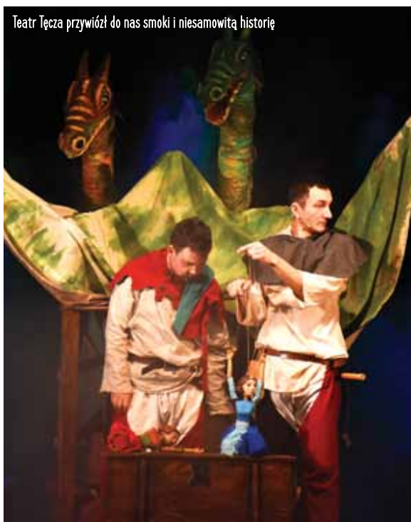
Teatr Tęcza przywiózł do nas smoki i niesamowitą historię