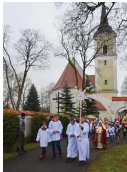
Kolorowy przemarsz Orszaku Trzech Króli