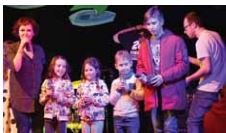
Mali i duzi pomagali nam w zebraniu rekordowej kwoty