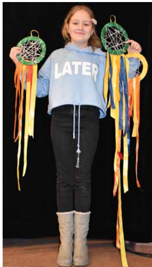
Czy wierzycie w magiczną moc Łapaczy snów?