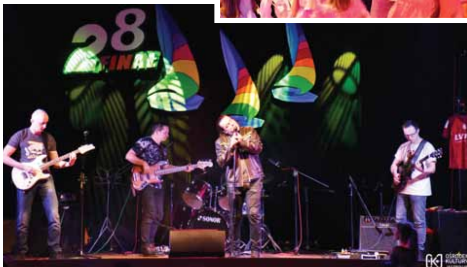
Koncert zespołu Zielone Pomidory podczas 28. Finału WOŚP