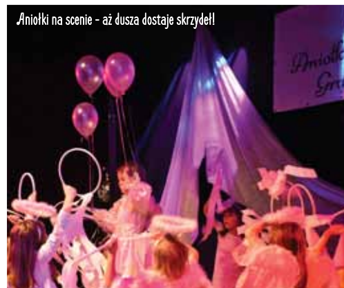
Aniołki na scenie - aż dusza dostaje skrzydeł!