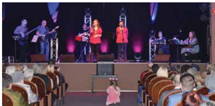
Aromatyczno-poetycki wieczór z Dużą Rajską Kawą