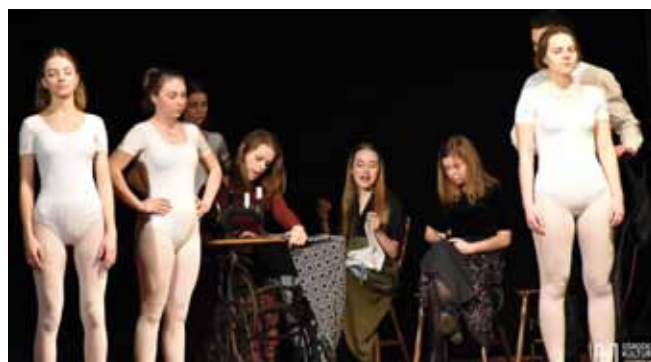
Młodzi i zdolni aktrycy Teatru Matysarek