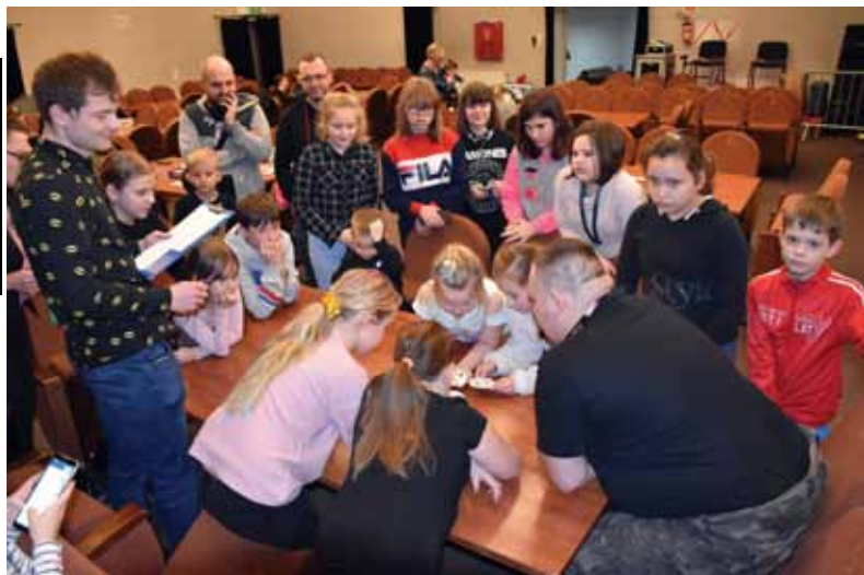
Emocje sięgały zenitu podczas Turnieju Gier Familijnych