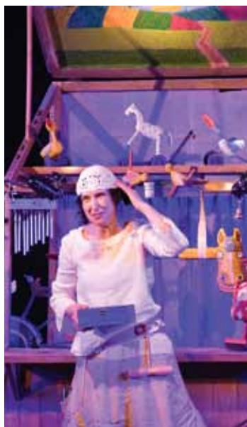
Pradawni ludzie i niedalekie krainy z Teatrem Małe Mi