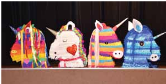
Kolorowe piniaty zrobione wspólnymi siłami