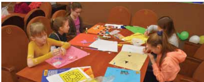
A co gdyby samemu zrobić sobie planszówkę?