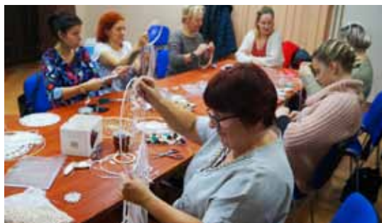
Łapacze dobrych snów w naszej bibliotece

Innowacyjność to COŚ co lubimy i wykorzystujemy podczas naszych wspólnych kreatywnych spotkań m.in. z Bum Bum Rurkami - dzieci je uwielbiają.