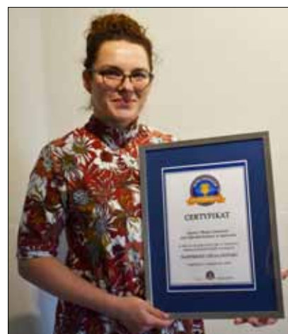
Oficjalny certyfikat jest już w naszych rękach!

Szanowni Państwo, po sześciu miesiącach weryfikacji materiałów dowodowych dotyczących bicia rekordu Polski w kategorii "Największa lekcja historii" - mamy to!