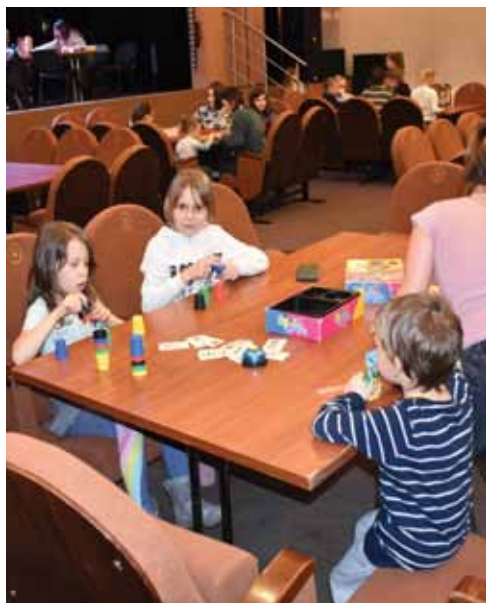
Spotkanie nie tylko z fantastyką lecz również z fantastycznymi grami i ludźmi