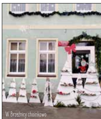
W Brzeźnicy choinkowo