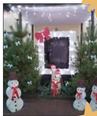
W Samborsku bałwankowo