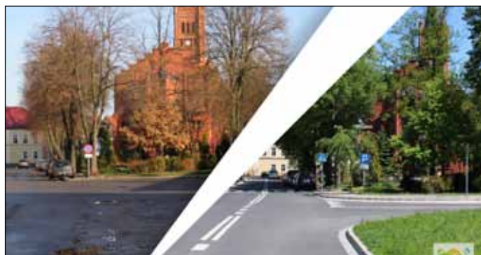
Pl. im. JP II przy nowej ul. Mickiewicza to teraz jedno z piękniejszych miejsc, gdzie lubimy częściej przebywać. Na zdjęciu ulica przed i po remoncie