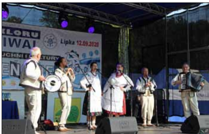
Podczas Festiwalu folkloru w Lipce nasza Kapela okazała się bezkonkurencyjna