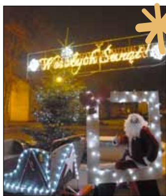
W Jastrowiu Św. Mikołaj zaparkował saniami na Placu JP11