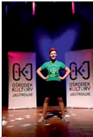
W czasie pandemii OKJ zadbał również o kulturę fizyczną. Zajęcia zumbi online cieszyły się dużą oglądalnością