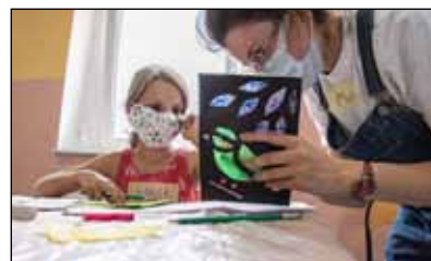
W Brzeźnicy dzieci poznały tajemnice tworzenia witraży dzięki warsztatom z Wędrownym Zakładem Kultury