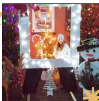
W Brzeźnicy Kolonii jak w bajce