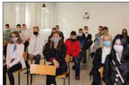
W tym roku ZS przyjął 36 uczniów do I kl. W sumie w szkole uczy się ponad stu uczniów

Burmistrz podziękował również radnym, którzy wytrwale o szkołę w Jastrowiu walczyli, pracodawcom zaangażowanym w proces kształcenia zawodowego oraz wszystkim, którzy dołożyli starań w powodzenie tego projektu. Burmistrz podkreślił, że nie była to decyzja podjęta z dnia na dzień, bo temat przejścia szkoły był tematem kontrowersyjnym, poruszonym od dłuższego czasu. Jednak jedyną szansą, by uchronić szkołę przed jej zamknięciem, było jej przejęcie przez gminę. Burmistrz wierzy, że podjęta decyzja jest słuszna i przyczyni się do rozwoju Gminy i Miasta Jastrowie, bo, jak twierdzi, „Jastrowie zasługuje na to, by mieć swoją szkołę ponadpodstawową”. Zwracając się do uczniów, podziękował za wybór naszej szkoły zaznaczając, że tu naukę będzie trzeba traktować poważnie, a w nagrodę za to przewidziane jest stypendium. Uczniowie klas pierwszych otrzymali symboliczne niespodzianki z życzeniami powodzenia w nowym roku szkol-