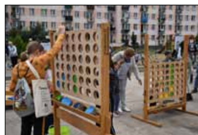
Wielkoformatowe gry dla całej rodziny zintegrowały wszystkich

Ekologiczny quiz i wspólne układanie logotypu naszej gminy to kolejne atrakcje, wśród których dostępne były również wielkoformatowe, ręcznie robione gry dla całej rodziny: sianie ziarna, wykonywanie makram czy zajęcia zumbi, zapoznały dzieci z fitnawykami. Cykl OsiedLOVE