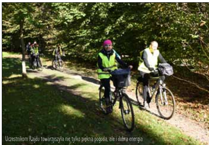
Uczestnikom Rajdu towarzyszyła nie tylko piękna pogoda, ale i dobra energia