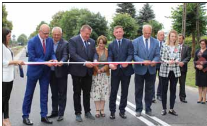
Uroczyste otwarcie przebudowanego odcinka drogi powiatowej nr 1013P pomiędzy Sypniewem a Brzeźnicą