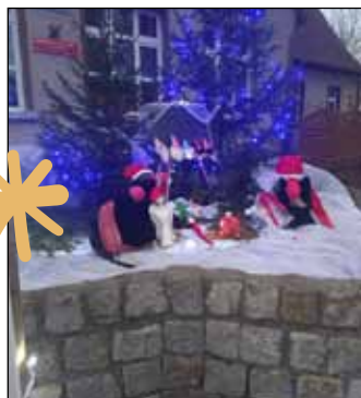
W Nadarżycach pojawiła się ferajna skrzatów