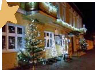
W Sypniewie zagościł renifer i anioły