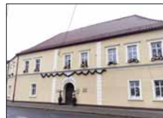
Nasza złota biblioteka