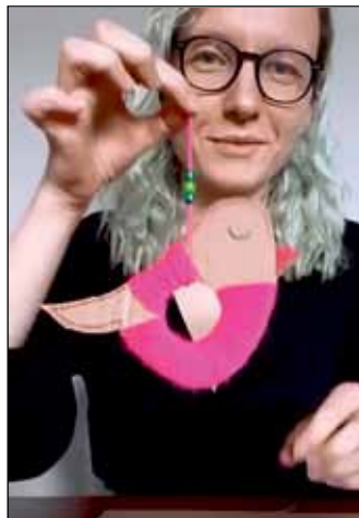
Z warsztatami kreatywnymi "Zrób to sam w domu" spotkamy się podczas ferii zimowych

Tymczasem w Jastrowiu razem z profesjonalnym instruktorem jogi uczestnicy OsiedLOVYCH Wakacji z OKJ rozciągali się i relaksowali przy spokojnych dźwiękach natury i specjalnych instrumentów.