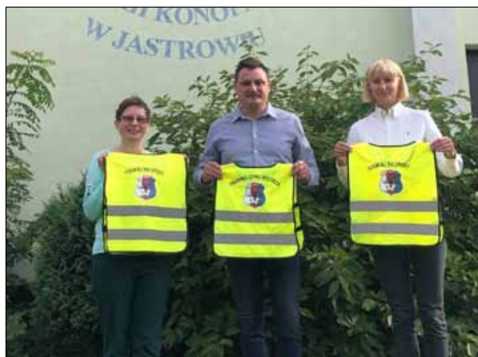
Kamizelki odblaskowe zapewne poprawią bezpieczeństwo maluszków podczas spacerów