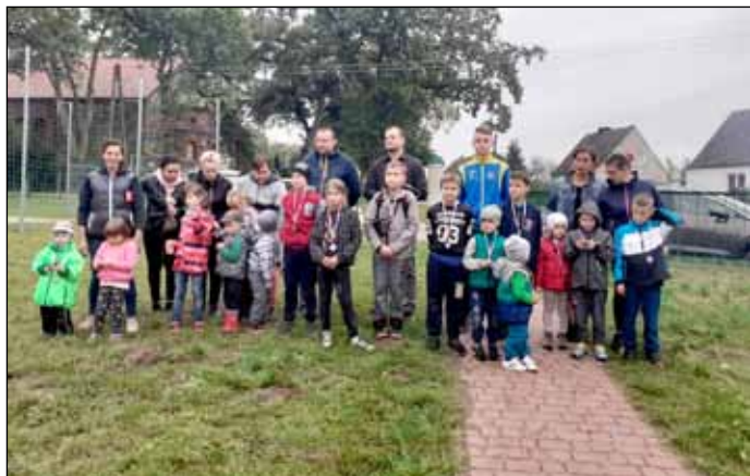
Najmłodszych nie trzeba namawiać do gry, wystarczy podać im tylko...piłkę