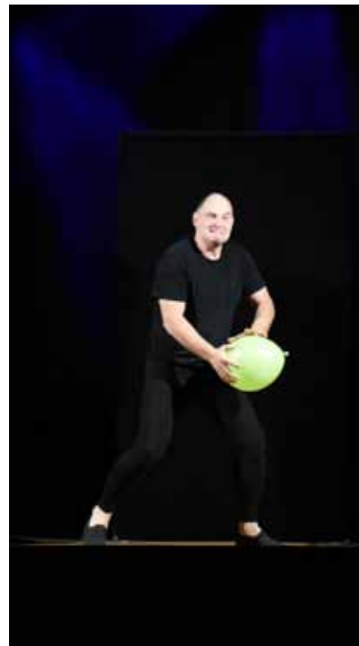
Dzięki luźnej atmosferze i anegdotom mima, wieczór ten był miłą odskocznią od codzienności