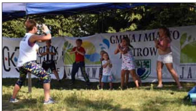
Jest zumba, jest energia!