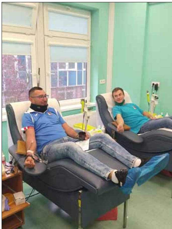
Oni wiedzą, że w grupie siła. Kiedy potrzebna jest pomoc, pomagają nie tylko sobie na boisku.