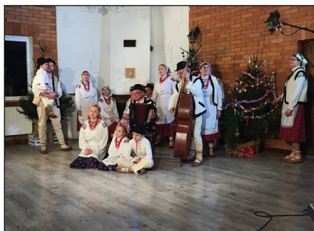
Wielopokoleniowy Zespół Górali Czadeckich „Pojana”

"Pod stołem kładzie się siano, na siano kilka orzechów. Na zaścielony stół najpierw kładzie się dwa „kołaczki”, „huskę soli”, czosnek, dwie kolby kukurydzy, świeczkę, opłatek(...). Obowiązkowo na stole powinien znaleźć się bób - symbol dostatku przez cały rok."