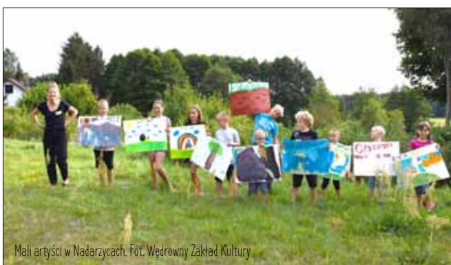
Mali artyści w Nadarzycach.