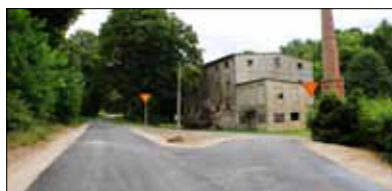
Ulica w Samborsku