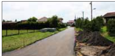
Droga w Brzeźnicy

W ramach budowy dróg gminnych zakończono również prace na Osiedlu DJ Jedności Robotniczej w Jastrowiu – odcinki ul. Okrężnej i ul. Klonowej. Zakres prac, za ponad 500 tysięcy zł obejmuje: budowę jezdni, obustronnych chodników i zjazdów do posesji z kostki betonowej oraz budowę wpustów kanalizacji deszczowej wraz z przykanalikami.