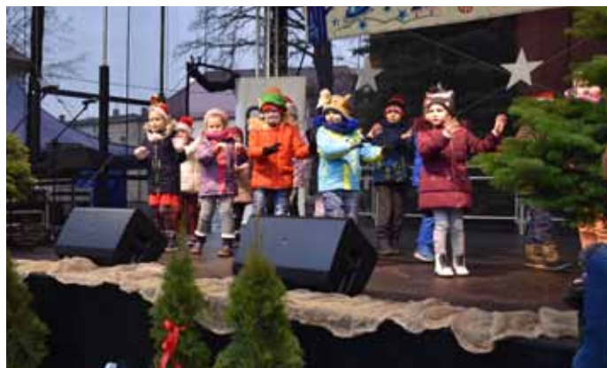
Dzieci z Przedszkola Samorządowego

możliśmy podziwiać najmłodszych artystów ze Żłobka Tuliś i Przedszkola Samorządowego. Swoją debiut miała grupa wokalo-taneczna Polish Tradition ze świetlicy wiejskiej w Samborsku. Świąteczne piosenki śpiewali wokaliści ze studia wokalnego oraz sekcji wokalnej dla dorosłych działających przy OKJ oraz grupa dziewcząt z MOW. Specjalnym punktem programu było Studio Tańca Flow z Piły z fragm. spektaklu Zimowe Impresje. Całość zakończył niepowtarzalny występ grupy tanecznej ze STiS Perfect. Wyłoniliśmy zwycięzców konkursu świątecznego „Pierwsza