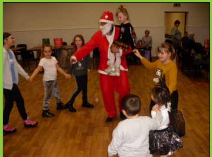
Mikołaj odwiedził również dzieci w Wiejskim Domu Kultury w Sypniewie

ry odwiedził nasze świetlice wiejskie podczas tegorocznych wakacji. Zajęcia rozwijały dziecięcą wyobraźnię i kreatywność, której dzieci mogły dać upust.