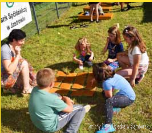
Gminny Dzień Dziecka w Samborsku