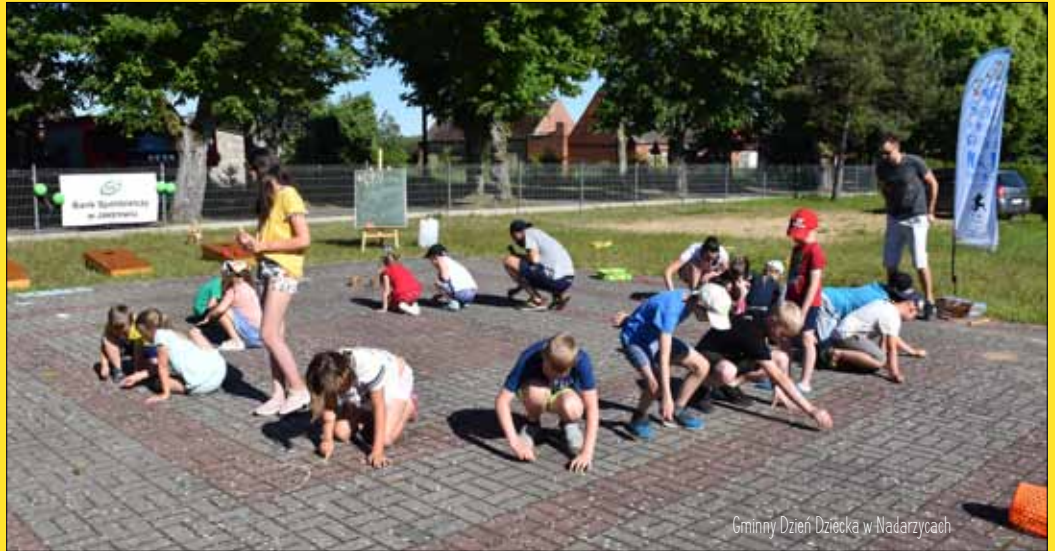
Gminny Dzień Dziecka w Nadarzynach