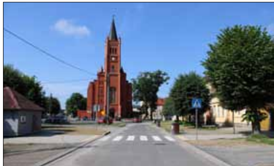
Ul. Konopnicka w Jastrowiu

W lipcu zakończyliśmy inwestycję związaną z przebudową ulicy Konopnickiej w Jastrowiu za ponad milion dwieście tysięcy zł. Wyremontowany został odcinek drogi między ul. Wojska Polskiego a ul. Poniatowskiego: nowa nawierzchnia jezdni zjazdów i chodników, 45 miejsc postojowych, w tym jedno dla osób niepełnosprawnych. W ramach robót dodatkowych wymieniono na całej długości kolektor deszczowy, wpusty uliczne wraz z przykanalikami oraz zamontowano nowe elementy kanalizacji deszczowej odwodnienia jezdni i chodników.