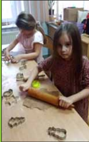
Warsztaty pieczenia pierniczków w Świetlicy Wiejskiej w Brzeźnicy

Św. Mikołaj nie zapomniał odwiedzić z paczkami również najmłodszych z naszych sołectw. Ośrodek Kultury w Jastrowiu wspólnie z Sołtysami, Radami Sołeckimi, Kołami Gospodyń Wiejskich i rodzicami wsparli tradycyjnie Mikołajki we wsiach Nadarzycze, Brzeźnicy, Sypniewie, Brzeźnicy Kolonii i Samborsku.