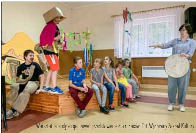
Warsztat legendy zorganizował przedstawienie dla rodziców.