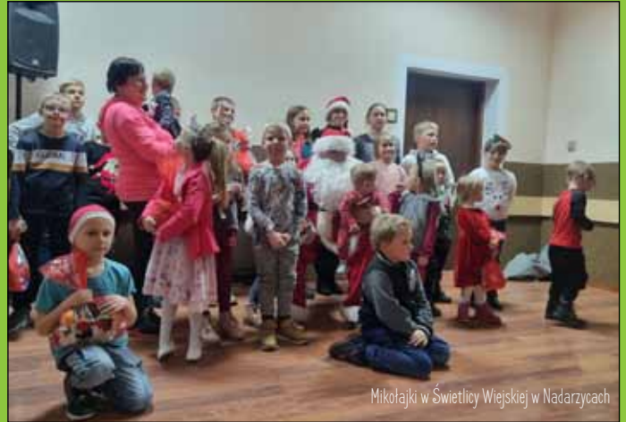
Mikołajki w Świetlicy Wiejskiej w Nadarzycach