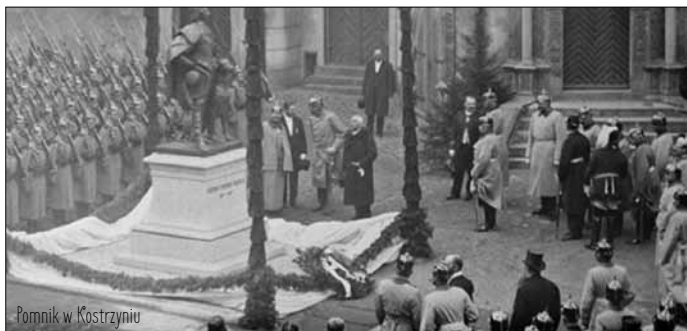
Pomnik w Kostrzynie