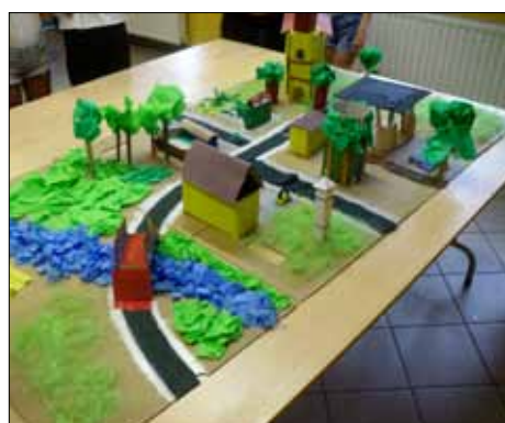
Makieta architektoniczna Sypniewa, powstała podczas warsztatów Archijuniorki