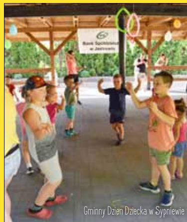
Gminny Dzień Dziecka w Sypniewie