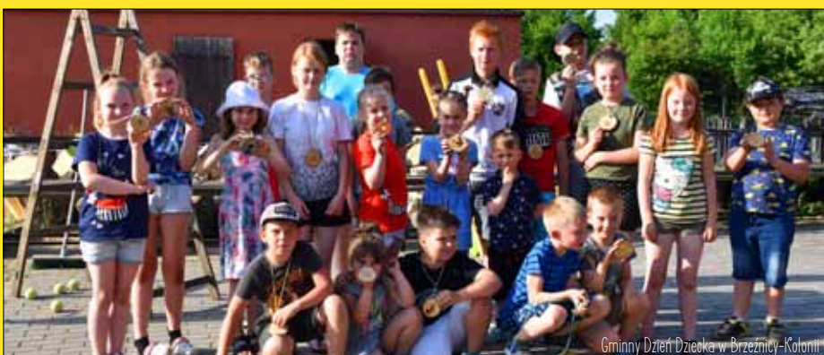
Gminny Dzień Dziecka w Brzeźnicy-Kolonii