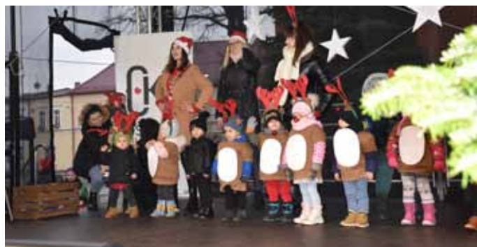
Pierwszy sceniczny występ dzieci podczas tegorocznego Jarmarku Mikołajkowego

z opiekunkami o tym, jak funkcjonuje żłobek i jakie są plany jego rozwoju. Włodarze naszego zwiedzili zaadaptowane pomieszczenia i co najważniejsze przekonali się jak przyjazna, wspierająca rozwój dzieci atmosfera panuje w żłobku. Każdy dzień powinien być dniem dziecka, dlatego też nie zważając na datę w kalendarzu, dzieci otrzymały powitalne prezenty w postaci maskotek, potocznie nazwanych Misiem TULISIEM,