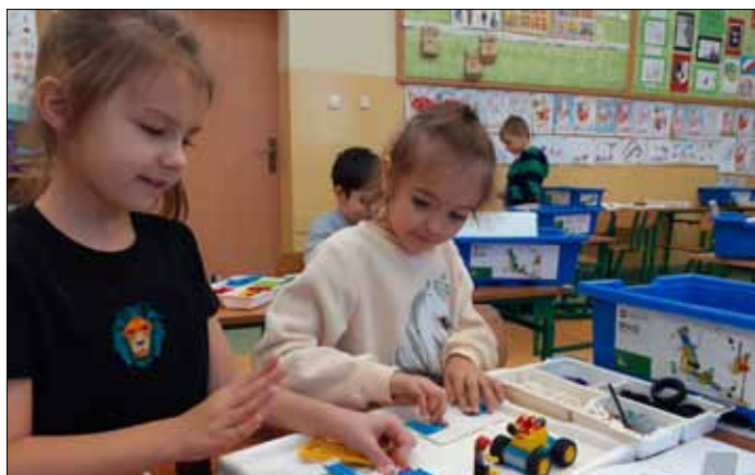
Nasi mali programiści i architekci

N owy rok szkolny to nowe wyzwania, którym czoła będziemy stawiać z Zestawami LEGO® Education. W tym roku szkolnym dzieci w klasach 1-3