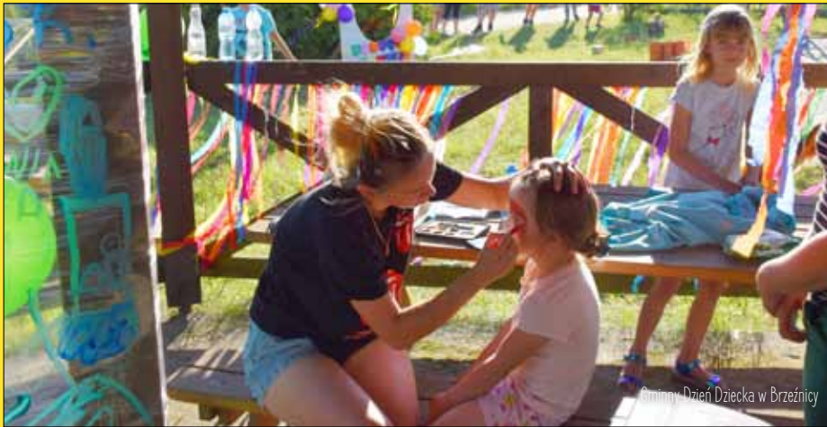
Gminny Dzień Dziecka w Brzeźnicy