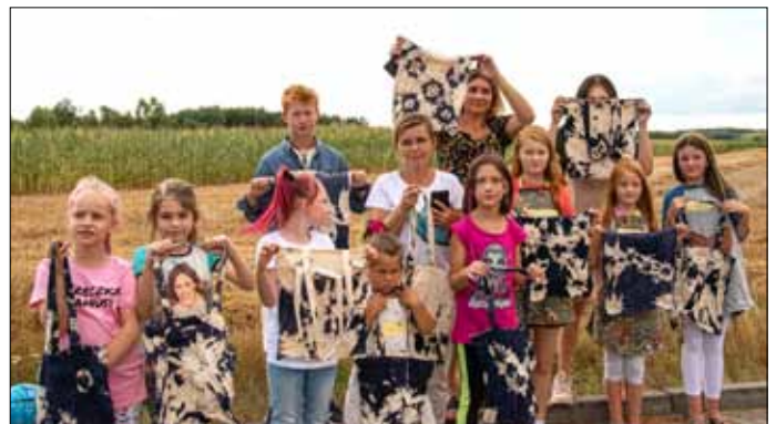
Malowane tkaniny w Brzeźnicy Kolonii.