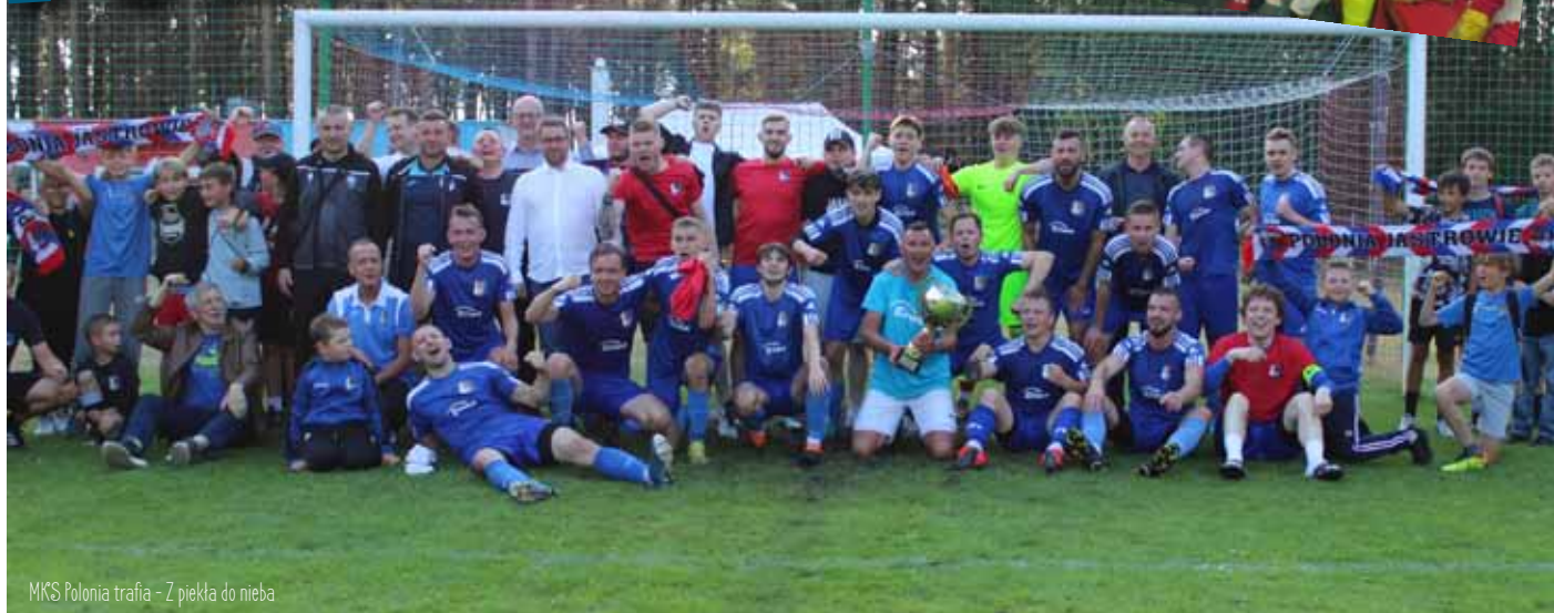
MKS Polonia trafia - Z piekła do nieba

P olonia Jastrowie ma za sobą historyczny sezon. Po rundzie jesiennej, w której nasza miejska drużyna zajmowała IV miejsce ze stratą aż 10 punktów do lidera tabeli – Klubu Piłkarskiego Piła, chyba nikt się nie spodziewał, że ostatni mecz 30. kolejki pomiędzy tymi drużynami zadecyduje o bezpośrednim awansie do V ligi. A jednak. Wiosną nasza drużyna zagrała kon-