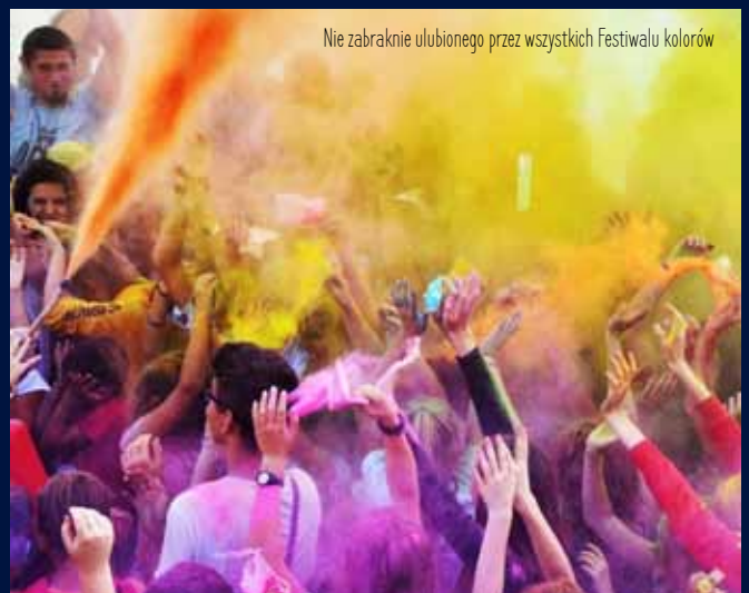
Nie zabraknie ulubionego przez wszystkich Festiwalu kolorów

zales zapewnią sporą dawkę dobrej zabawy i zastrzyk adrenaliny. Dopełnieniem będzie festiwal dmuchańców z trampolinami, zamkami z postaciami z bajek, kulkami. Wskocz na najlepszą imprezę i daj upust energii.