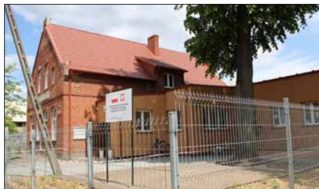
Wyremontowany budynek Przedszkola w Sypniewie