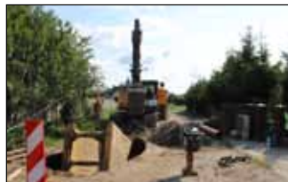
ul. Boczna w remoncie