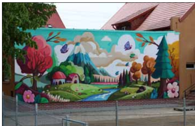
Mural na elewacji Przedszkola w Sypniewie