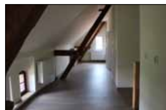
Nowe poddasze przedszkola