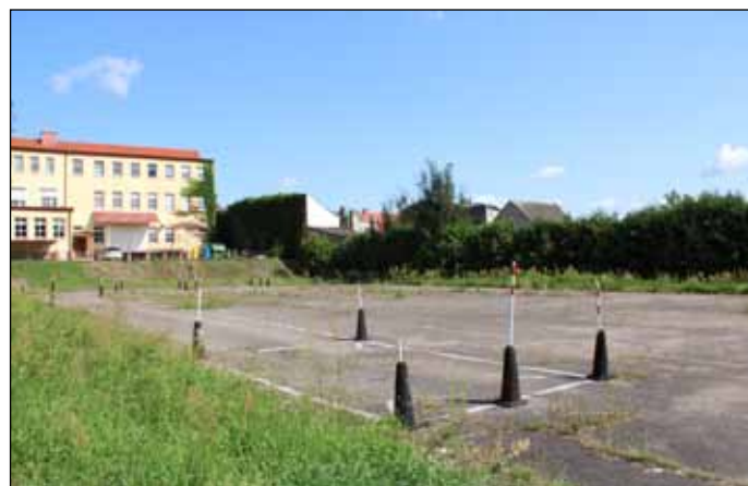
Teren, na którym powstanie wielofunkcyjne boisko sportowe

z siedzibą w Budach. Dotychczas wykonano już pewien zakres prac remontowych wewnątrz i na zewnątrz budynku. Orestaurowano oryginalne drzwi wejściowe, pokryto schody zewnętrzne kamieniem, wstawiono okna, wyremontowano dach, oczyszczono ściany wewnętrzne i zewnętrzne. Finalnie obiekt służyć będzie mieszkańcom Gminy Jastrowie jako centrum edukacji ekologiczno-przyrodniczej, organizowane tu będą również wydarzenia kulturalne, budynek będzie miał też charakter galerii sztuki, w której organizowane będą czasowe wystawy, oraz zagości tu stała ekspozycja „Muzeum Czasu” poświęcona historii wsi Budy i jej mieszkańców.