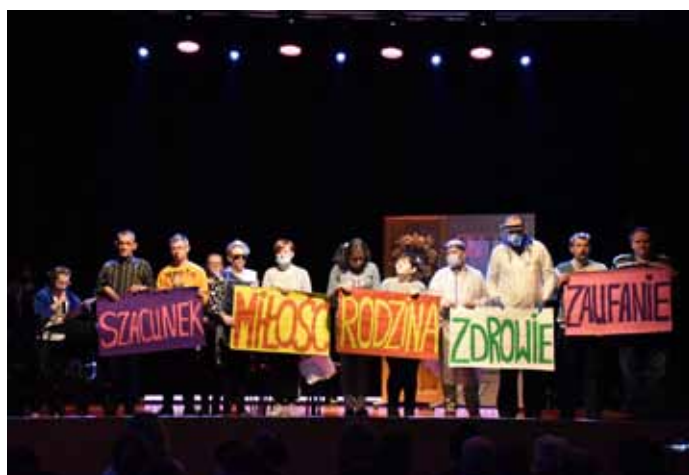
Na scenie uczestnicy z WTZ Jastrowie