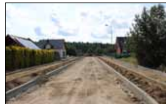
ODJ ul. Jesionowa