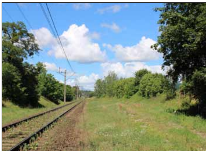
Teren nowego przystanku PKP Jastrowie Miasto