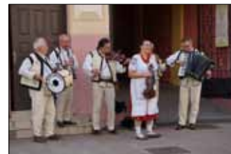
Kapela Bukowińska Jastrowiaczy w Czerniowcach przed Domem Polskim

Bukowińczyków z pochodniami, płonęły ogniska, panny puszczały wianki na wodę, a tancerze i soliści zagrali obrzęd świętojański. Niesamowite. Magiczne. Cudne. Należy dodać, że Bukowińskie Spotkania to nie tylko Jastrowie i Piła, ale także inne kraje i miejscowości. Nasi Jastrowiacy gościli w Czerniowcach w dniach 7-10 lipca, gdzie zostali wspaniale przyjęci, wiadomo, że w bardzo trudnym dla Ukraińców czasie. Podczas koncertu zostały zebrane fundusze