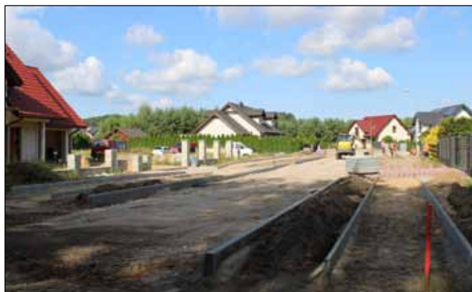
Osiedle Domków Jednorodzinnych ul. Okrężna