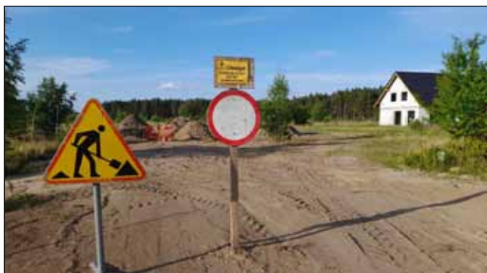
Budowa kanalizacji na Osiedlu Sosnowym w Jastrowiu