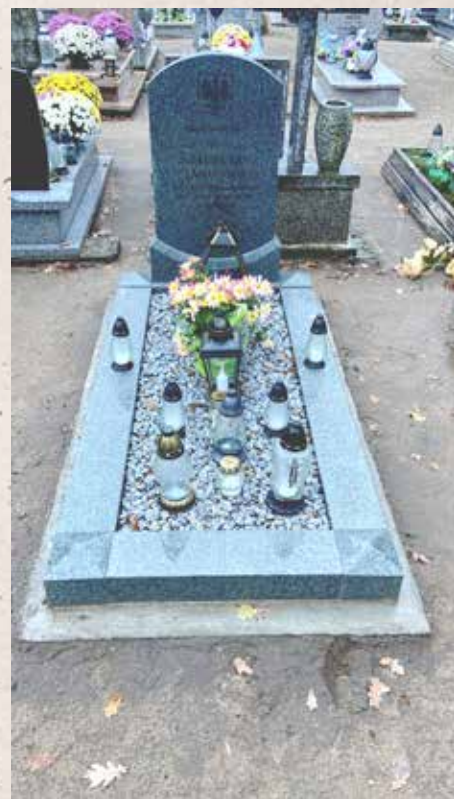
Nagrobek sporządzony według wzorca przyjętego w województwie wielkopolskim wykonała firma kamieniarska z Chodzieży.