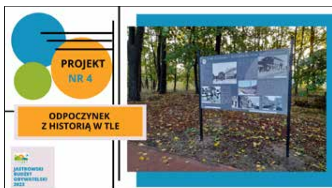
Projekt nr 4 zgłaszająca projekt: Urszula Żmudzińska - Czerwonka - liczba głosów 377 - IV miejsce w głosowaniu