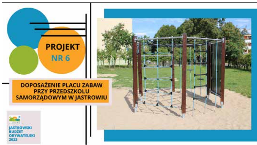
Projekt nr 6 zgłaszający projekt: Tomasz Wojtunik - liczba głosów 511 - I miejsce w głosowaniu