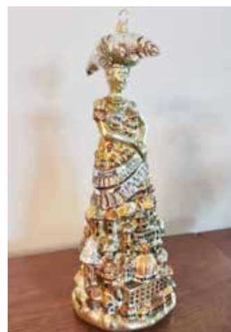
Bombka zaprojektowana przez artystę-malarza, Tomasza Sękowskiego