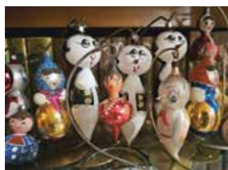
Bombki z PRL

Głównym przedmiotem kolekcji są współczesne ręcznie malowane bombki formowe,