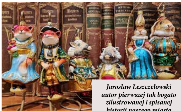
Seria leśne zwierzęta