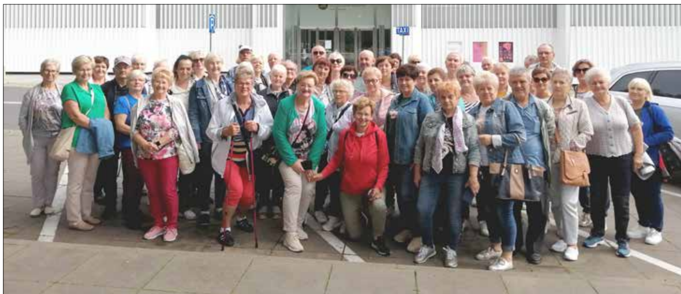
Nasi Seniorzy czerpią z dorobku kultury w każdym miejscu. Filharmonia im. M. Karłowicza jako jedyna budowla z Polski znalazła się na liście 200 najbardziej znaczących dzieł architektury współczesnej