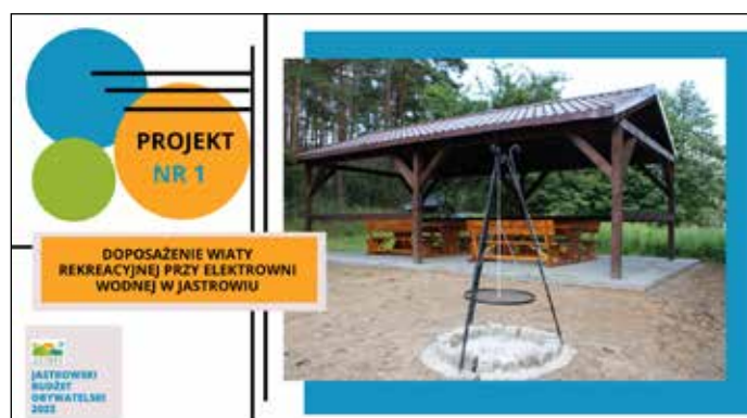
Projekt nr 1 zgłaszający projekt: Piotr Maliszewski - liczba głosów 457 - III miejsce w głosowaniu