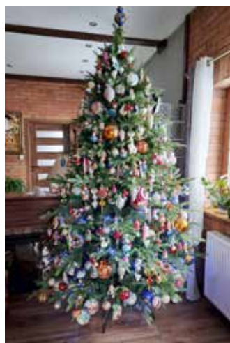
Moje choinki 2022 r.

Zamiłowanie do pięknych bombek zrodziło się u mnie chyba już pod koniec lat osiemdziesiątych, kiedy wraz z moją trzyosobową rodziną otrzymaliśmy nasze pierwsze małe mieszkanie w bloku we Wrocławiu. Ale kolekcja powstała chyba 10 lat później, kiedy przeprowadziliśmy się do rodzinnego miasta mojego dziadka, do Warszawy. Tam mieszkanie było większe, więc ustawialiśmy też znacznie większą choinkę. Zawsze wspominałem wtedy dzieciństwo w Złocieńcu, kiedy w każdą wigilię razem z rodzicami szliśmy do dziadków na drugim końcu miasta. Jedliśmy tam kresowe potrawy wigilijne, które świetnie przygotowywała moja pochodząca z Polesia babcia, a tradycję ich przygotowywania sprawnie przejęła pochodząca z centralnej Polski moja mama. Pamiętam, że na choince dziadków, pod którą spoczywały prezenty dla nas wszystkich, wisiały też piękne bombki. Ręcznie malowane z tzw. reflektorami. Zawsze chciałem odtworzyć też atmosferę z lat dzieciństwa, czego elementem było poszukiwanie pięknych bombek. Mój tato opowiedział mi kiedyś, że w przedwojennym mieszkaniu w Pińsku, dziadkowie ustawiali dwie duże piękne choinki w salonie. Dziadek był zawodowym żołnierzem i kierownikiem maszyn na okręcie wojennym ORP „Kraków”, więc stać go było na wynajęcie dużego mieszkania w Pińsku. Tak się złożyło, że zachowało się jedno zdjęcie ze Świąt Bożego Narodzenia w mieszkaniu dziadków w Pińsku, które prezentuję w tym artykule. Kiedy