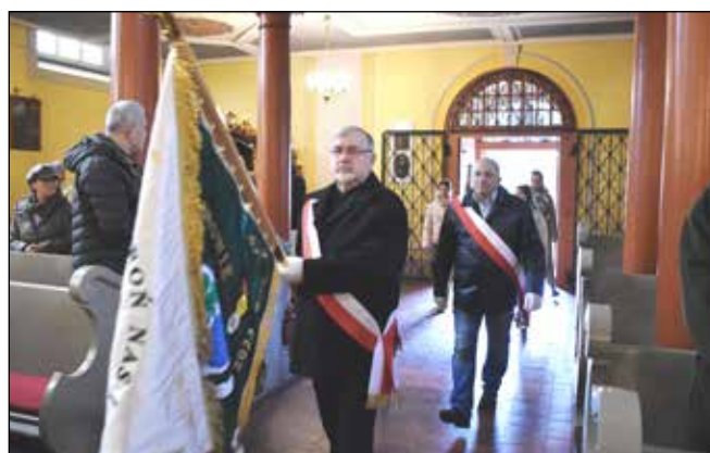
Poczet sztandarowy Koła Pszczelarzy z Jastrowia podczas Święta Niepodległości

Regionalna Dyrekcja Ochrony Środowiska w Poznaniu