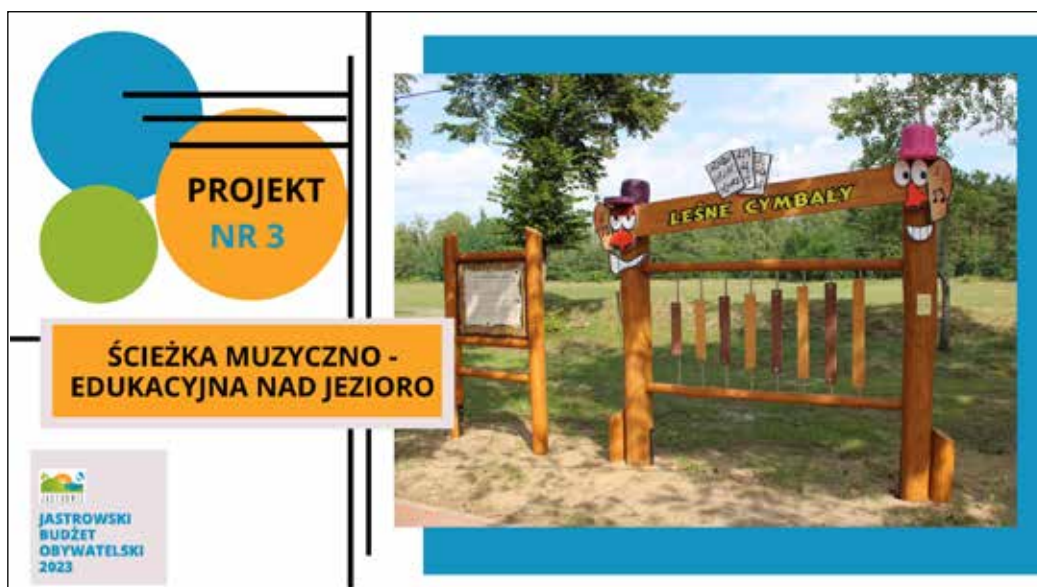
Projekt nr 3 zgłaszająca projekt: Monika Król - liczba głosów 485 - II miejsce w głosowaniu