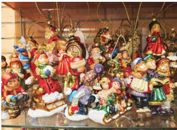
Bombki z serii wiktoriańskiej

Jarosław Leszczelewski Fot. ze zbiorów prywatnych autora