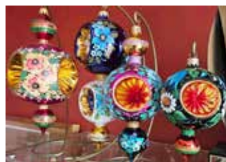
Bombki malowane przez Ukrainki, które schroniły się w Polsce przed wojną